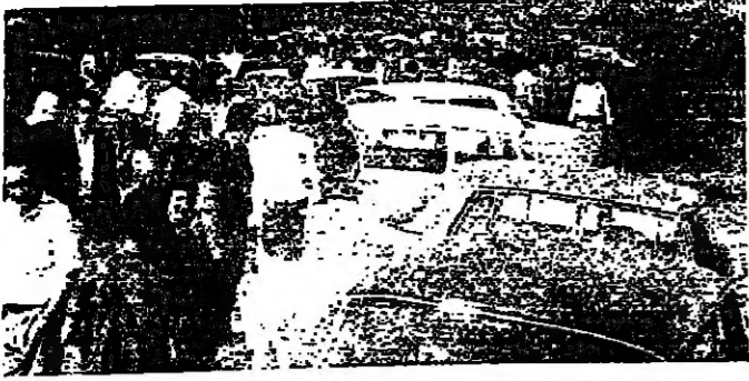
طريق المنية كما بدت بعد ان انقلها سائقو السيارات الخصوصية (تصوير محمد المصري)

طريق المنية كما بدت بعد ان انقلها سائقو السيارات الخصوصية (تصوير محمد المصري) طرابلس - من مكتب «الانوار»: شهدت الطريق الرئيسية المؤدية الى بلدة المنية ، قبل ظهر امس ، ازدياداً شديداً في حركة السير ، عندما اقدم سائقو السيارات الخصوصية العاملة بالاجرة على سد الطريق ووضع سياراتهم في وسطها ، وتوقفوا محاذي الضيق بخطهم ، وكان من نتيجة ذلك ان تعطلت حركة السير تماماً ، وتوقفت عشرات السيارات عاجزة عن الحركة ، وتمنع وصول الطلاب والاساتذة الى مدارس المنية ، ومدارس عكار ، والدوائر الرسمية والكراسات .